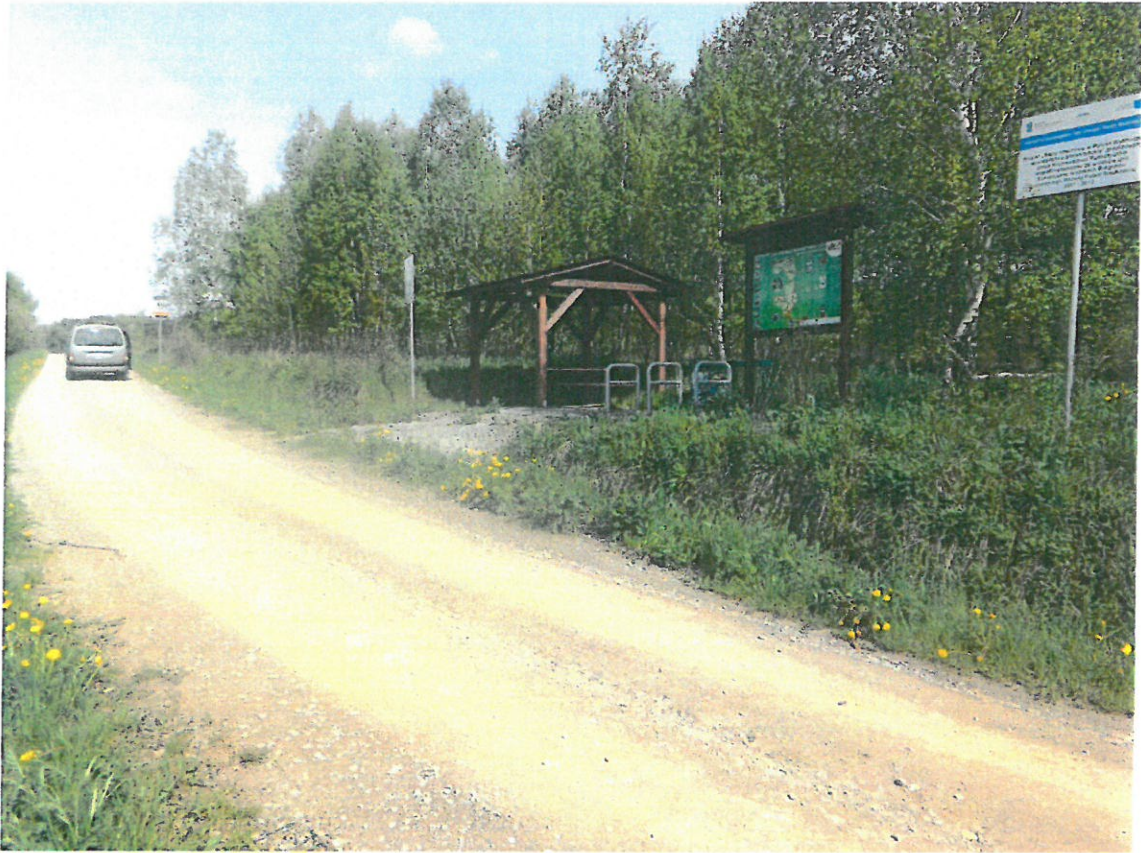
Ścieżka rowerowa Green Vello