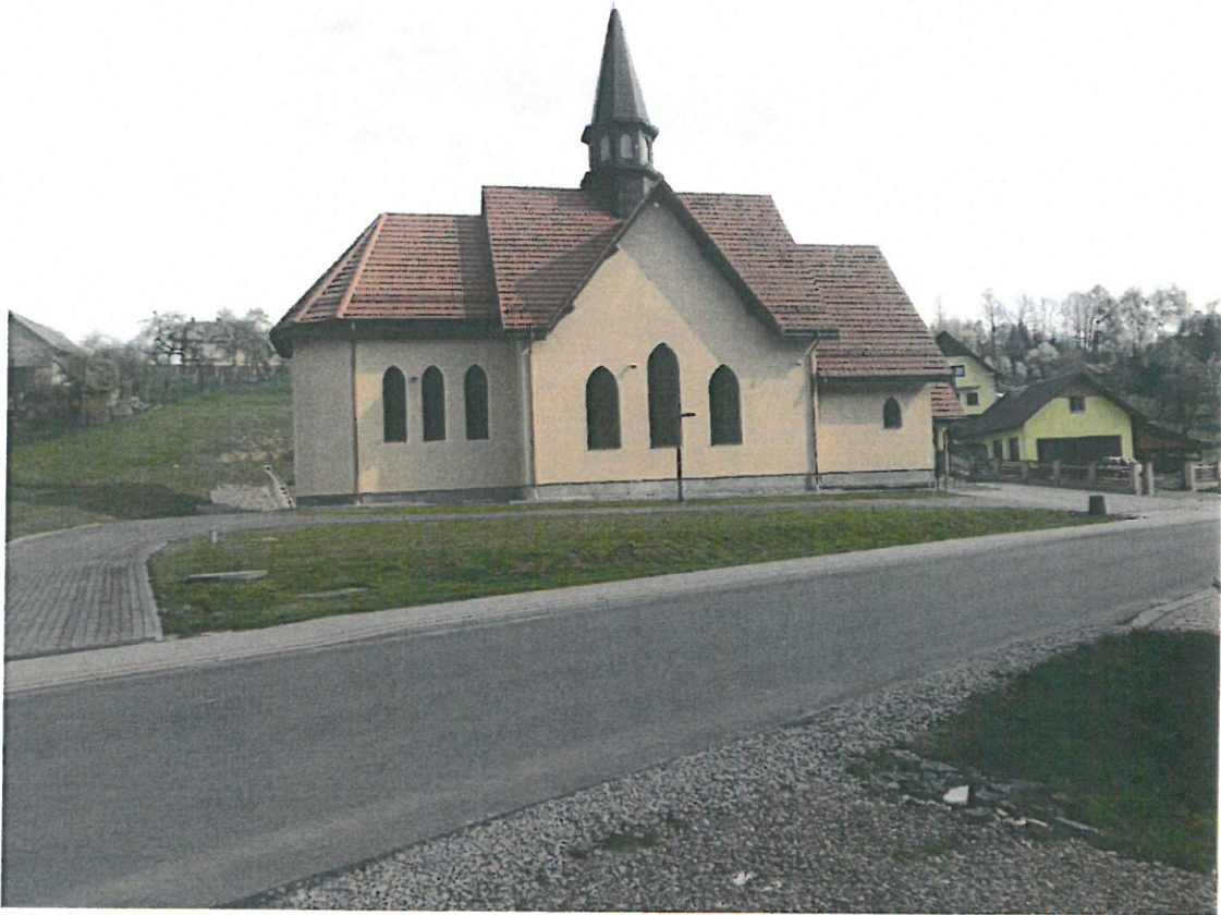
Kościół Parafialny p.w. Najśw. Serca P. Jezusa