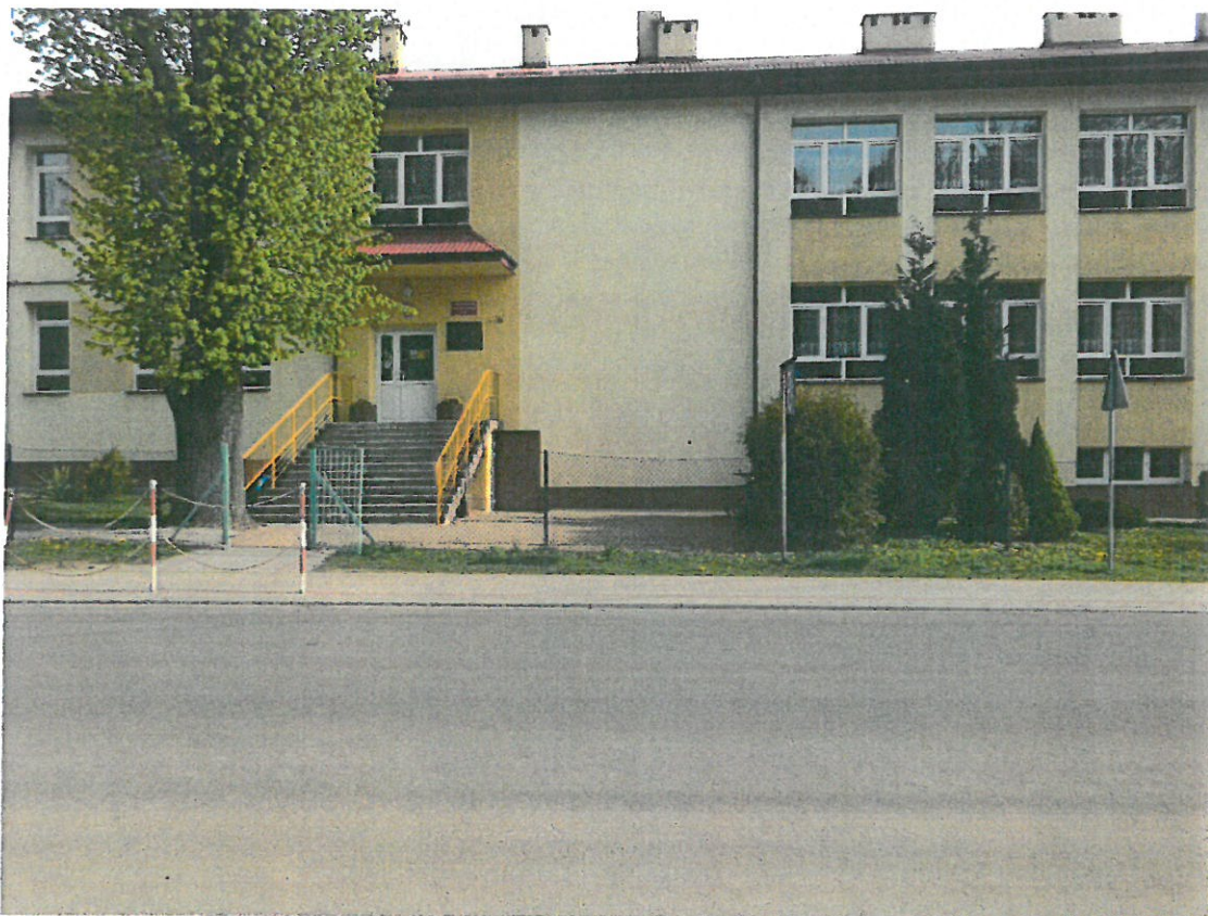
Szkoła Podstawowa im.kardynała S.Wyszyńskiego w Lecce