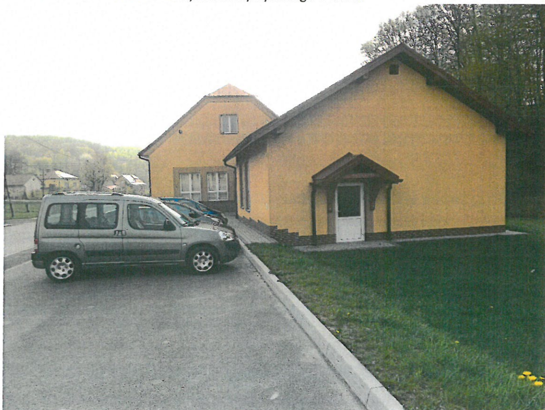
Świetlica Wiejska w Lecce oraz budynek OSP