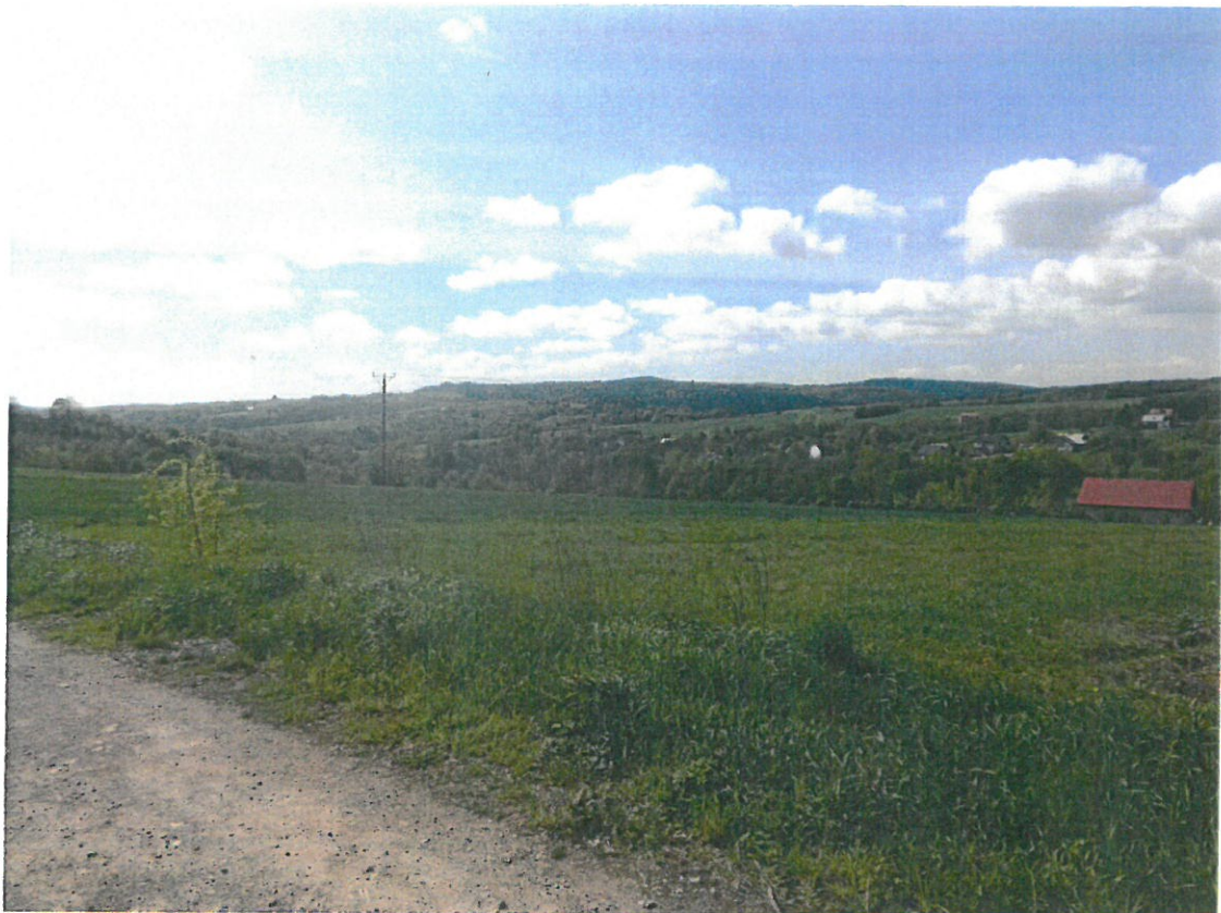
Pagórki i wzniesienia w otoczeniu zabudowy wsi