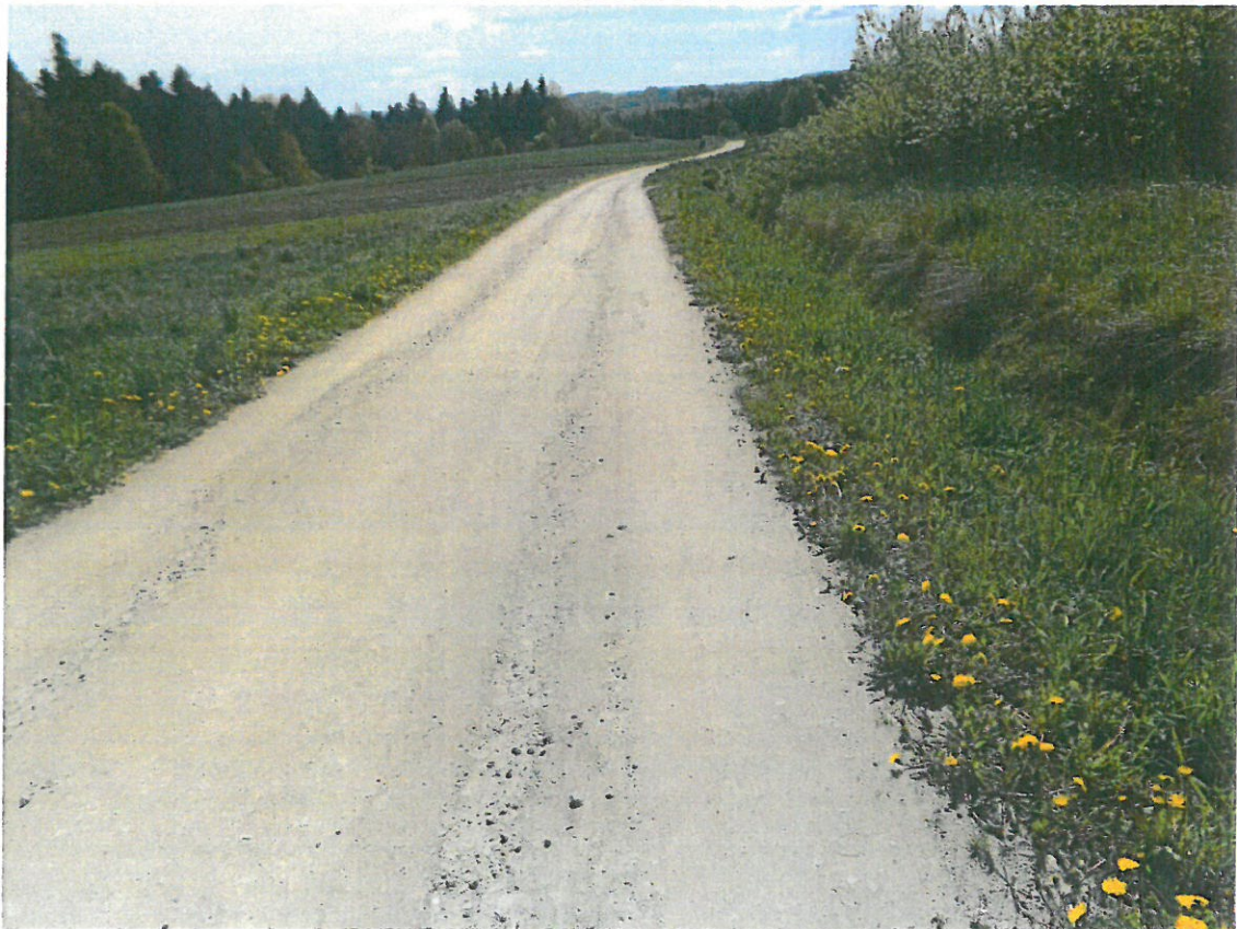
Bogata szata roślinna , kręte drogi gminne